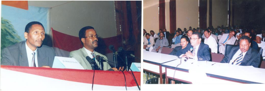
Kab. Pir.BMNO Obbo Kumaa Dammaqsa yaa'ii yeroo gaggeessan(1987-1992)

Filannoo Biyyoleessaafi Naannoolee Marsaa 1 ffaa bara 1987 naannoo filannoo akka naannootti jiru 177 irratti gaggeeffameen bakka bu'oanni ummataa filatamaniiru. Naannoo filannoo tokkoon tokkoon irraa bakka bu'oanni lama lama akka filataman kan yaadame ta'us naannoo filannoo tokko irraa kaadhimamaan tokko qofti waan dhiyaateef teessumni Caffee 353 qabu Waxabajjii bara 1987 yaa'ii hundeeffamaa gaggeessuun hojiisaa jalqabeera.